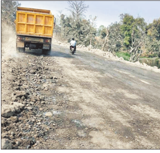
छाल मुख्य मार्ग और पुरंगा पहुंच मार्ग।